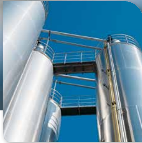
Kontrollierte Erdung sichert Produktionsanlagen vor gefährlichen Entladungen