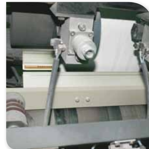
Stranghaftungssysteme sind Standard bei Neumaschinen und überall nachrüstbar.

Wenn in der Druckmaschinenanlage das Problem von Schnittdifferenzen und umgeschlagenen Ecken auftritt, sind elektrostatische Systeme die Lösung. Durch elektrostatische Verblockung der Stränge vor dem Querschneiden können Eltex Stranghaftungssysteme in Falzapparaten an Illustrations-Tiefdruck- und vor allem an Heatset-Rollenoffset-Maschinen für höhere Falzgenauigkeit und höhere Geschwindigkeit sorgen.