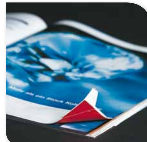
K.O. für Schlagecken durch elektrostatische Verblockung.