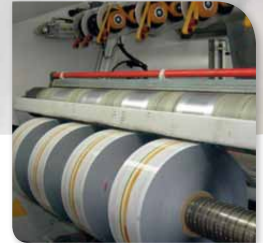
Entladesystem an Rollenschneidemaschinen