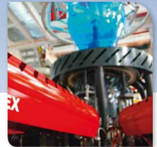
Entlade- und Aufladesysteme an Extrudern (im Bild W&H)

Vielleicht brauchen Sie Eltex und wissen es noch gar nicht. In diesem Fall helfen wir in einem Beratungsgespräch gerne bei der Problemanalyse und Entscheidungsfindung.