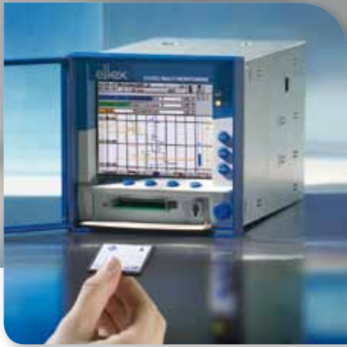
Messgeräte sorgen für Überwachung und Dokumentation der Effizienz eingesetzter Entladesysteme