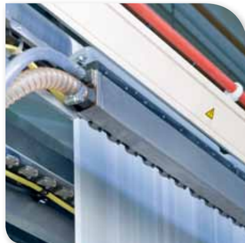
Der WEBMOISTER eignet sich für breite oder kleine Maschinen aller Geschwindigkeiten.