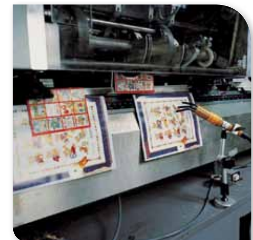
Gezielte Aufladung in der Druckweiterverarbeitung

Vorteile haben jene Bereiche, in denen das Phänomen der Elektrostatik nicht neutralisiert werden muss, sondern mithilfe der richtigen Technik sogar genutzt werden kann. Lädt man beispielsweise Papiere oder Kunststoffe ungleich auf, kann man sie elektrostatisch miteinander verbinden. Elektrostatisches „Verkleben“, Verblocken oder Haften hat mehrere Vorteile: Es hinterlässt keinerlei Spuren, bleibt während des gesamten Arbeitsprozesses stabil und löst sich danach entweder von selbst oder durch gezielte Entladung.