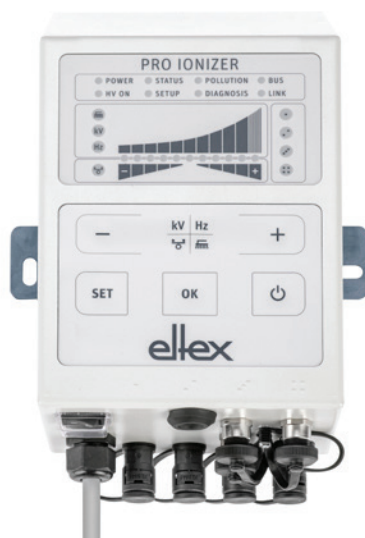
PRO IONIZER avec clavier à membrane